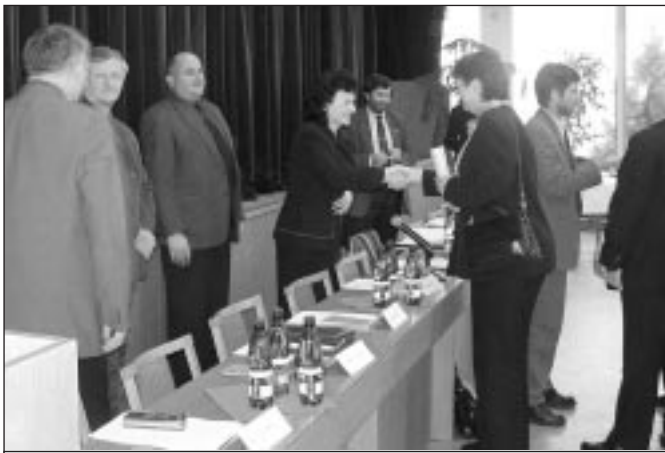
20. ledna proběhlo 1. setkání zástupců samospráv s novou radou kraje Vysočina. Setkání se konalo v Třešti a zhruba čtyřem stovkám přítomných starostů se představil nový hejtmán, radní i poslanci a senátoři.