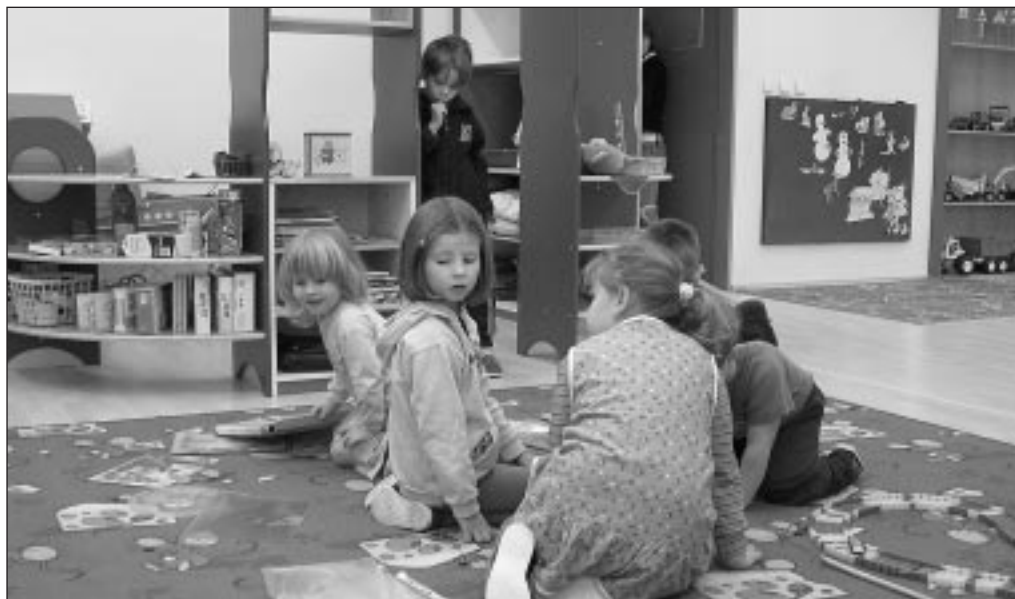
Od Nového roku chodí naše děti do nově vybudovaných prostor mateřské školy v budově školy základní.

2. února, 16. února, 2. března, 16. března, 30. března, 6. dubna, 20. dubna, 4. května, 18. května, 1. června, 15. června, 29. června.