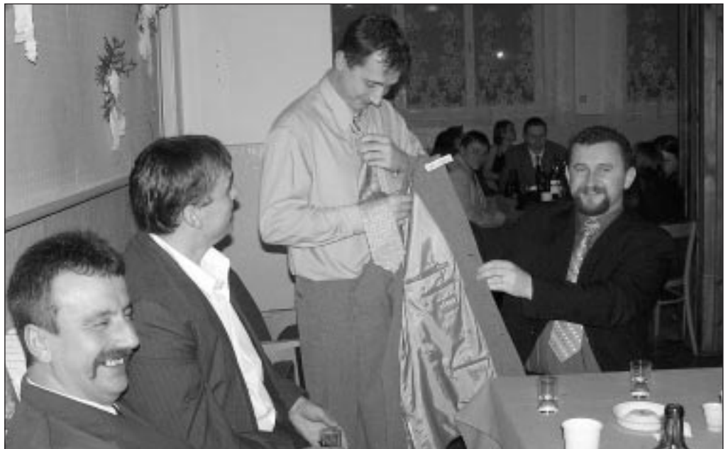
14. 1. 2005 se uskutečnil 4. Rodičovský ples. I přes nižší účast se ples vydařil.