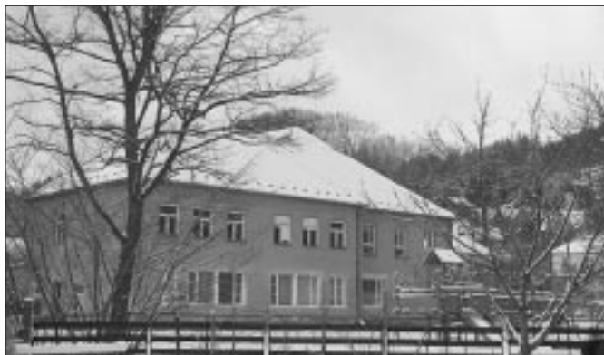
Takto se mění tvář školy nejen v ročním období, ale i postupnou přestavbou.

Od ledna 2005 byl v naší ZŠ zahájen kroužek angličtiny pro rodiče začátečníky, kteří se chtějí učit spolu se svými dětmi.