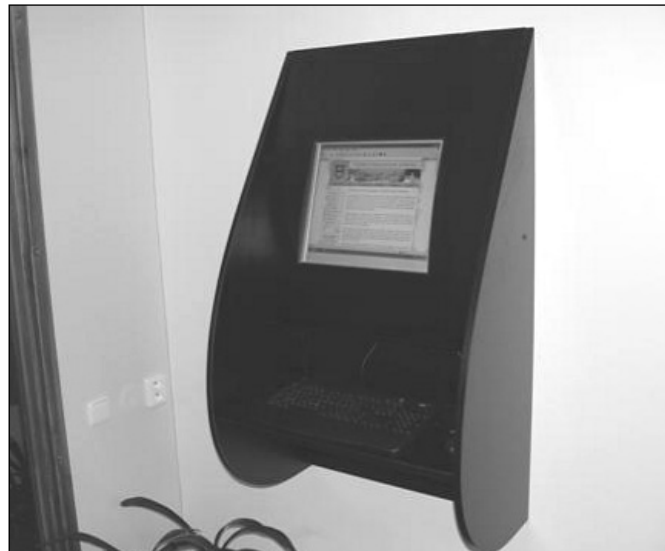
Dne 26.3.2007 byl ve vestibulu obecního úřadu zprovozněn internetový kiosek. Přístup pro obyvatele obce, ale i její návštěvníky je zdarma každý den v provozní době obecního úřadu.

I díky všem těmto novotám si naše stránky vylepšily své statistiky sledovanosti. V měsíci březnu je navštívilo poprvé více než dva tisíce návštěvníků a v dubnu nejspíš padne hranice deseti tisíc prohlédnutých stránek za měsíc. I proto figurují vírské stránky mezi prvními dvěma sty adresami v kategorii "Města a obce".