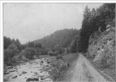
POZDRAV Z CHUDOBÍNA. PARTIE U HAMBU.

Děti ze ZŠ přivítaly jaro výletem do ráje bledulek u nedaleké vesnice Chlévské. Byla to opravdu krásna, posuňte sami.