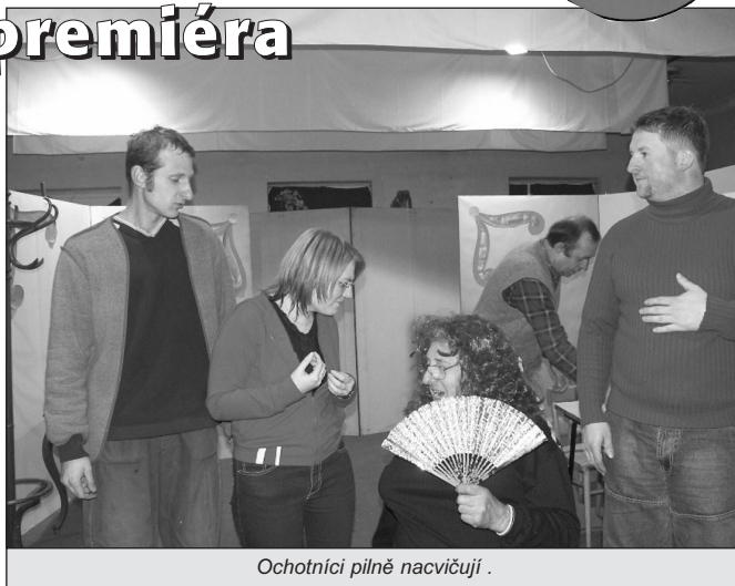
Ochotníci pilně nacvičují.

Oxfordské univerzitní koleje, konec 19. století. Spolužáci Charley a Jack mají v úmyslu požádat své