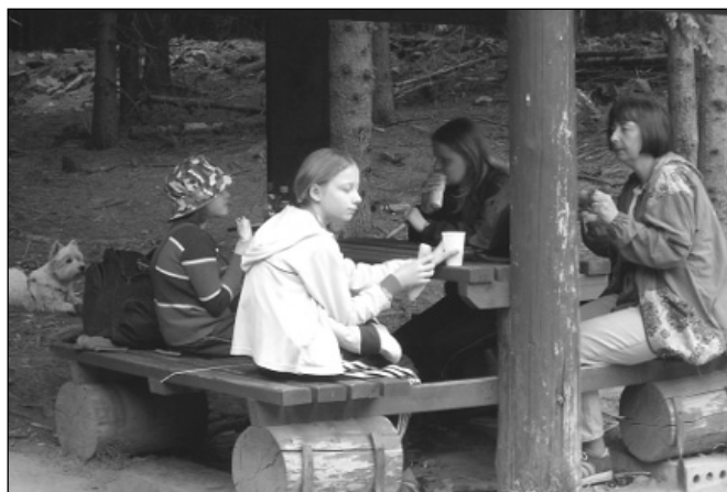
Odpočinek po výstupu na rozhlednu Horní Les

opěrné zdi a zábradlí, druhý úsek je prvním z úseků výměny prашného (jindy blátivého) chodníku za chodník ze zámkové dlažby. Dláždění provádí firma pana Jukla z Vysokého Mýta za vydatné pomoci naší rychlé roty, betonování římsy a chodníku provádí nezištně firma Skanska DS a.s. také s naší pomocí. Zábradlí na opěrné zdi chceme také využít k osazení informačních tabulí, které navedou hledající k poště, ubytovně, zdravotnímu středisku a k obecnímu úřadu. Na chodníky jsme získali dotaci z Programu obnovy venkova, římsu a zábradlí opravujeme za příspěvní krajské SÚS provoz Žďár nad Sázavou.